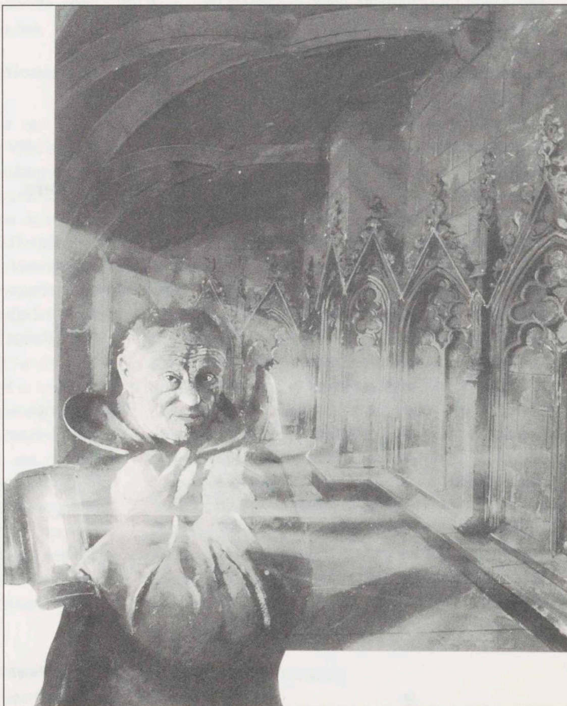
Afbeelding uit The Yorkshire Museum