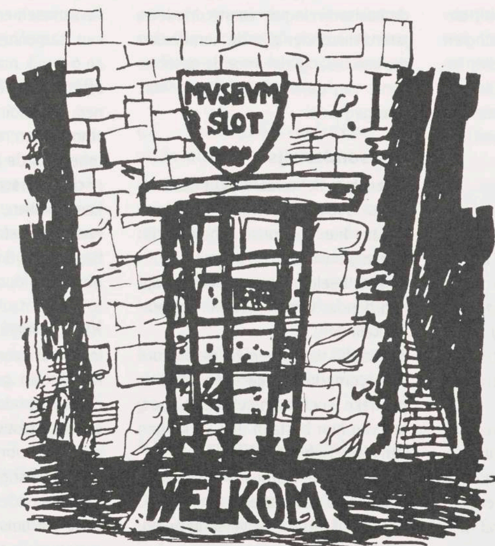
Musea moeten aandacht besteden aan de toegankelijkheid voor jongeren

Nú kunnen de musea goede contacten met het onderwijs opbouwen. Het vernieuwde onderwijssysteem (dat in de komende jaren ook uitgebreid wordt tot de bovenbouw) geeft musea de kans vernieuwde educatieve projecten op de markt te brengen.