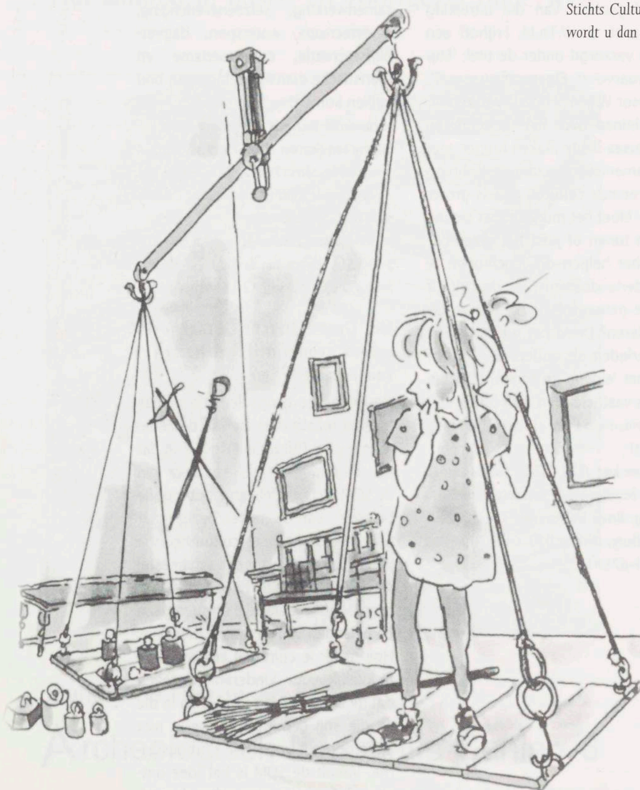
Afbeelding bij de Heksenwaag in Oudewater in het Groot Utrecht Ontdekboek, Elly Hees

In de provincie Utrecht is het Groot Utrecht Ontdekboek verkrijgbaar bij VVV's, musea en boekhandels en het kantoor van de SOM voor f 5,-. Te bestellen is het boek door overmaking van f 7,80 op Crediet en Effectenbank Utrecht 69.91.59.962 (giro-nummer bank: 75.651) t.n.v. Federatie Stichts Cultureel Erfgoed. Het Ontdekboek wordt u dan toegezonden. ■